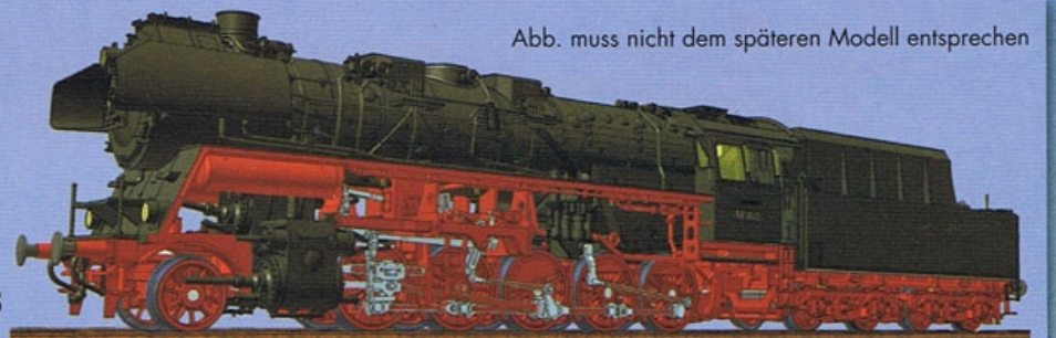
Abb. muss nicht dem späteren Modell entsprechen

76 100 Dampflokomotive BR 58.30 Reko der DR mit Neubautender 2'2'T 28