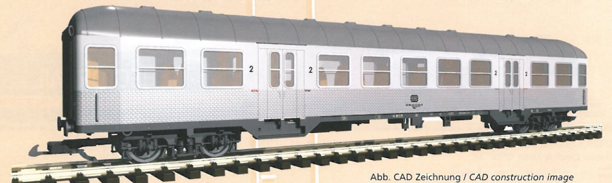
IV / 2011 37620 Nahverkehrswagen Bnb 720 2. Klasse, Silberling, DB Ep. IV / Passenger Car Bnb 720, 2. cl. DB IV

Abb. CAD Zeichnung / CAD construction image