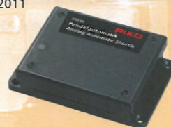
35030 89,99 €* Pendelautomatik, analog Analog Automatic Shuttle