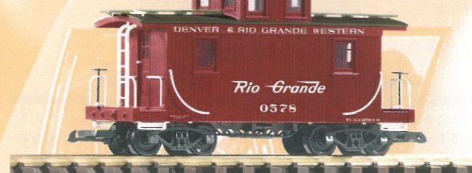
38814 Caboose D&RGW 52,99 €* D&RGW Caboose Vorserienmuster / pre-production sample