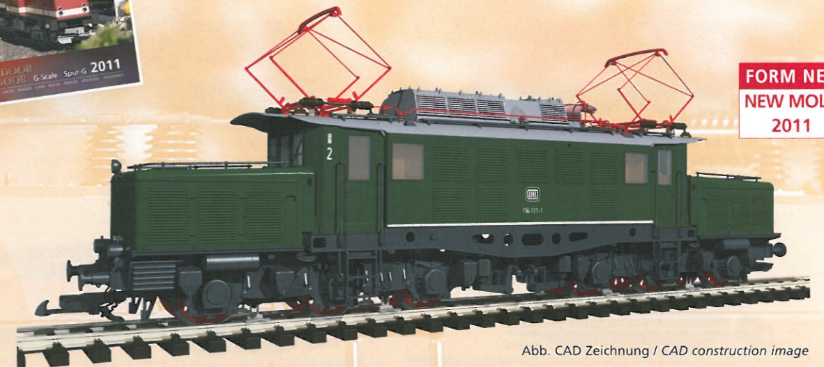
IV / 2011 37430 E-Lok BR 194 DB Ep. IV / Electric Loco BR 194 DB IV