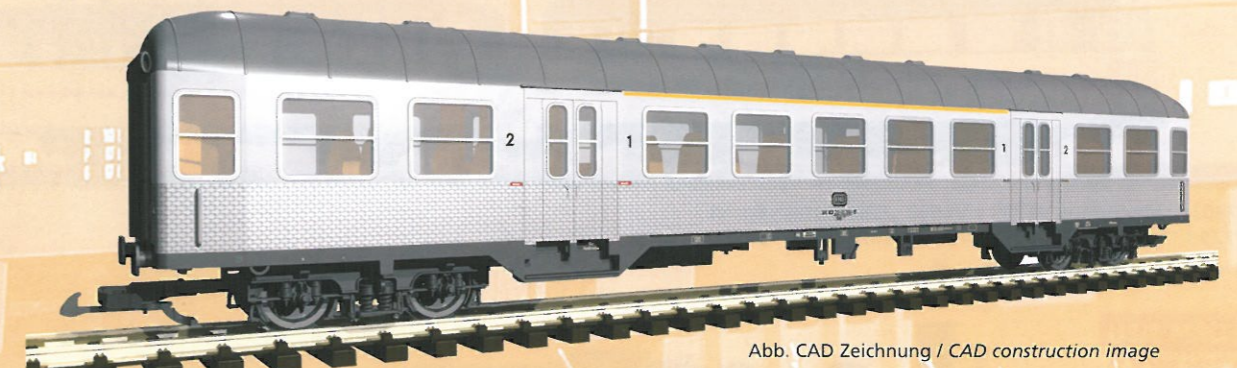
IV / 2011 37621 Nahverkehrswagen ABnb 703 1./2. Klasse, Silberling, DB Ep. IV / Passenger Car ABnb 703, 1./2. cl. DB IV

Abb. CAD Zeichnung / CAD construction image