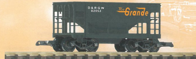
38813 Schüttgutwagen D&RGW 42,99 €* D&RGW Ore Car Vorserienmuster / pre-production sample