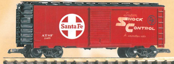
38811 Santa Fe Güterwagen 52,99 €* Santa Fe Box Car Vorserienmuster / pre-production sample