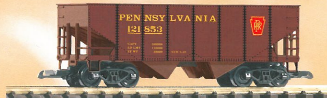
38812 Schüttgutwagen PRR 52,99 €* PRR Hopper Car rib side Vorserienmuster / pre-production sample